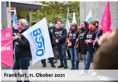
Frankfurt, 11. Oktober 2021