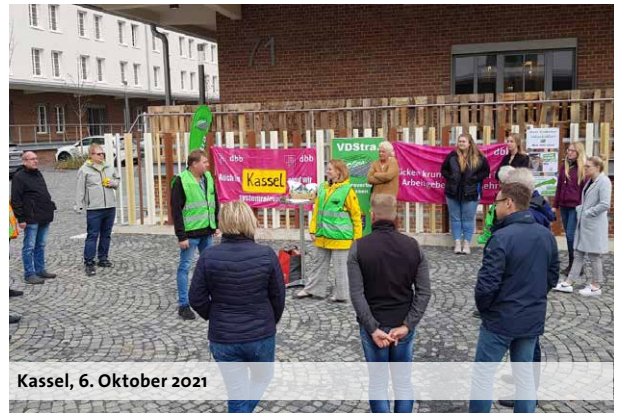
Kassel, 6. Oktober 2021

Die vollständige Tarifeinigung hat der dbb auf seinen Sonderseiten zur Einkommensrunde unter www.dbb.de/einkommensrunde ins Netz gestellt. Kurze Erläuterungen zu den Bestandteilen des Abschlusses geben wir in unserem Rundschreiben 13/2021.