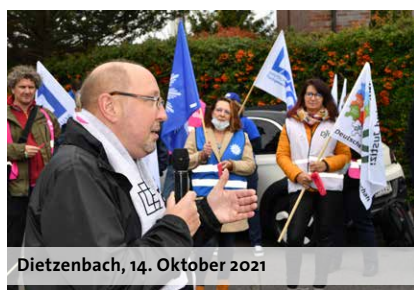
Dietzenbach, 14. Oktober 2021