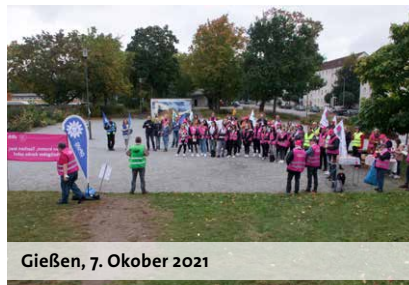
Gießen, 7. Oktober 2021