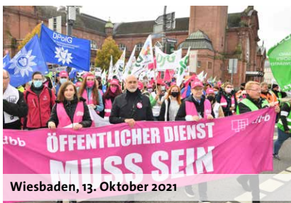
Wiesbaden, 13. Oktober 2021