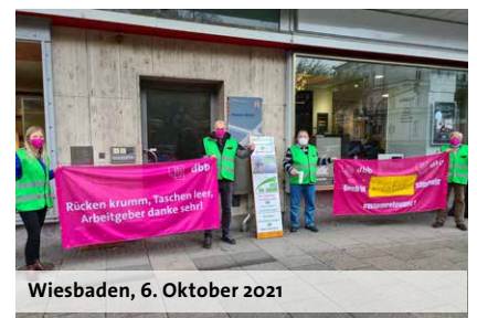
Wiesbaden, 6. Oktober 2021