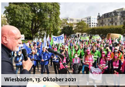
Wiesbaden, 13. Oktober 2021

Zum ersten Mal liegt der hessische Abschluss zeitlich vor dem Ergebnis der übrigen TV-L-Länder. Für dbb Tarifchef Geyer ist der hessische Abschluss durchaus geeignet, die schleppend angelaufenen Verhandlungen mit der Tarifgemeinschaft deutscher Länder (TdL) positiv zu beeinflussen. Geyer wört-