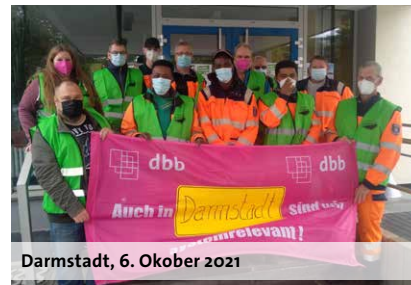
Darmstadt, 6. Oktober 2021

lich: „Natürlich sind das zwei Verhandlungen, die unabhängig voneinander zu sehen sind. Ich halte auch nichts davon, jetzt einzelne Ergebnisbestandteile von der TdL zu fordern. Was ich aber von der TdL fordere, ist, dass sie die Verhandlungskultur übernehmen, die die hessischen Verhandlungen geprägt hat. In Hessen haben die Tarifpartner abschlussorientiert verhandelt, haben auf Drohkulissen verzichtet und tatsächlich gemeinsam und erfolgreich den öffentlichen Dienst attraktiver gestaltet. Die TdL hat bisher nur die Keule des Arbeitsvorgangs geschwungen. Damit lässt sich der öffentliche Dienst jedoch nicht attraktiver gestalten.“