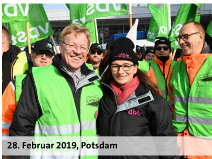
28. Februar 2019, Potsdam