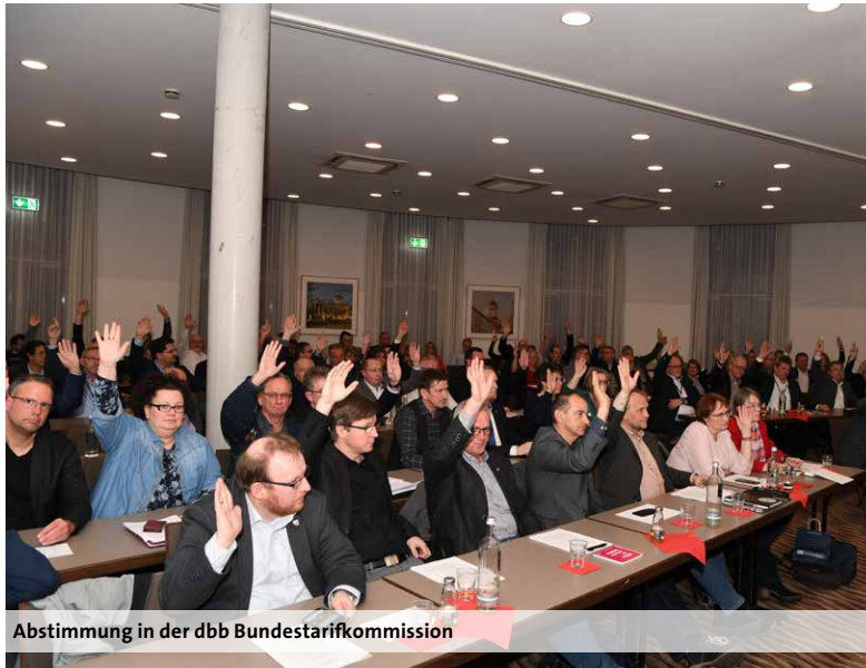
Abstimmung in der dbb Bundestarifkommission