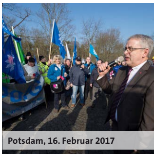
Potsdam, 16. Februar 2017